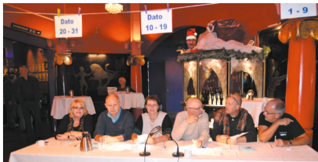
Indtjek til Generalforsamling 2013