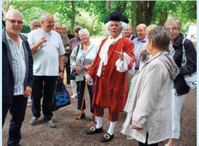
En rundtur på Gavnø slot er ikke bare en almindelig rundtur. Vi blev inddraget i en teaterforestilling, hvor guidernes optræden tog udgangspunkt i Gavnøs historiske personer på en spændende og underholdende måde.