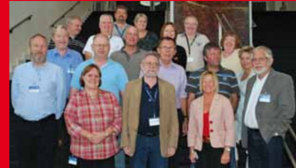
De delegerede fra Tele Øst.

Hele Metals mødestruktur var til debat og hovedbestyrelsen skal nu arbejde med den udfordring indtil næste kongres.